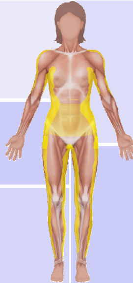
Segmentalwerte beruhen auf statistischen Näherungen!

Linkes Bein: Fett: 29,6 % Fett: 3,6 kg FFM: 8,6 kg